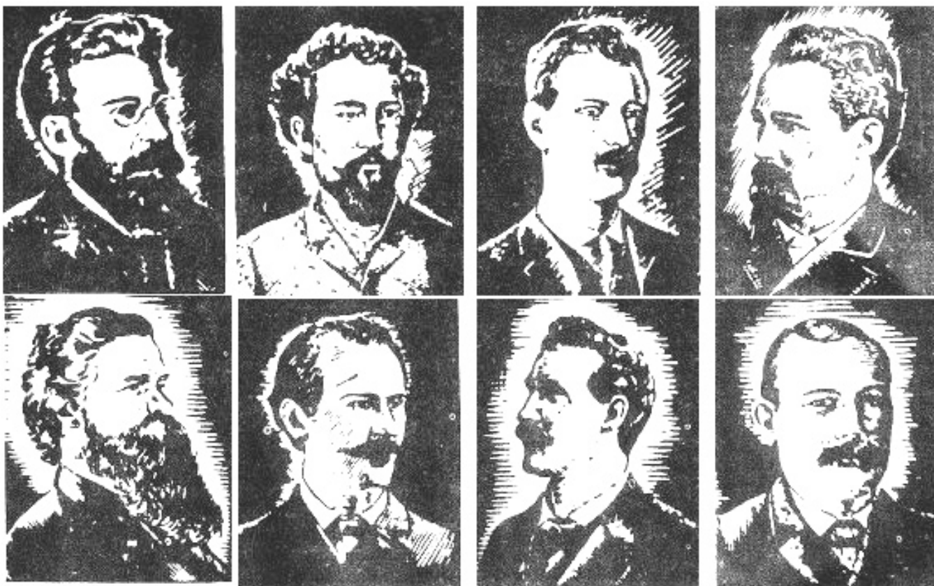
Los Mártires de Chicago