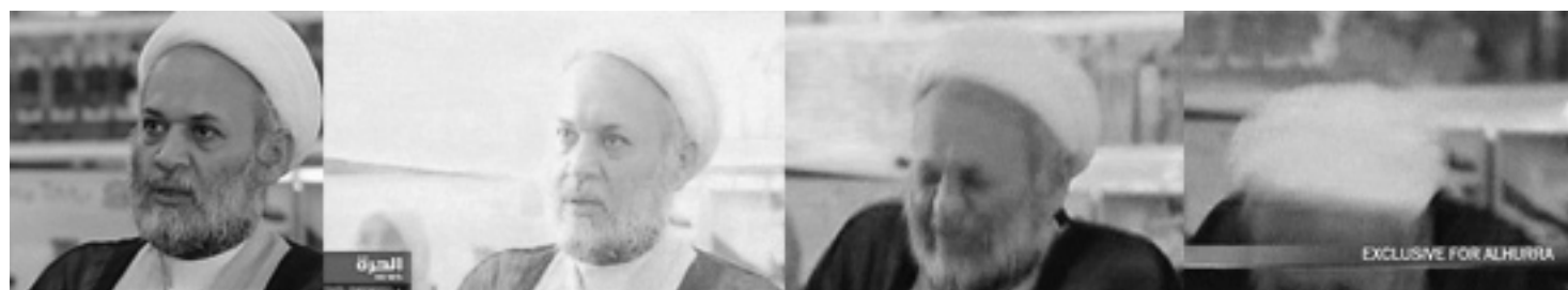
Agachada 1(arriba): Ban Ki-Moon, secretario de la ONU, sorprendido por el ataque de la Resistencia. Agachada 2(abajo): Diputado títere en el ataque al parlamento, dentro de la “Zona verde”.

Son tiempos difíciles para la política de las armas del imperialismo. En Afganistán recrudescen los ataques rebeldes y las tropas de la ONU sostienen una ocupación que podrá mantenerse por décadas pero sin posibilidad de cantar victoria. Si se trata de acortar tiempos hay un solo escenario probable: el triunfo talibán y el retiro del ejército de ocupación. A la luz de las palizas recibidas veremos en los próximos años cómo el poder mundial se las ingenia para rediseñar “la continuación de la política por otros medios” para, por lo menos, sacar un empate cuando sale de su cancha. ★