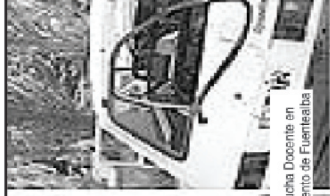
Represión a la lucha Docente en Neuquén y Fustigamiento de Fuentelba