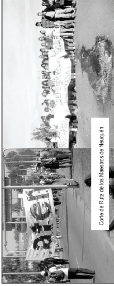
Corte de Ruta de los Maestros de Neuquén