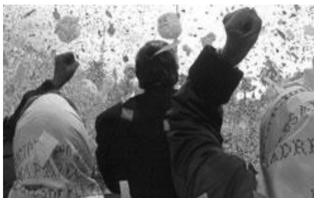
De espaldas al Pueblo.

Presidieron la concentración más clara de lo que es todo lo que dijeron odiar durante años. La de los punteros y la patota, la de los defensores de los genocidas, la de los que estuvieron junto a Luder en el no muy lejano 83 preparando una ley de amnistía que finalmente prohijaron los radicales. La concentración incluso de los dueños de las “Tres A” y de los que firmaron el decreto para nuestro aniquilamiento, es decir, para los que luchamos entonces por la única