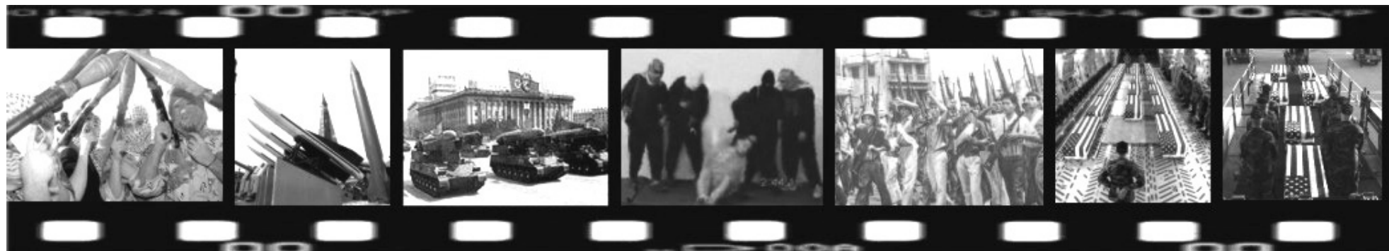
La película que los yanquis no quisieran ver. Toma 1: Resistencia Irakí. 2: Misiles Taepodong-1. 3: Desfile en Corea. 4: Ejecución de un “contratista” (mercenario). 5: Vietnam. 6 y 7: Volviendo a casa

Si observamos todos los condimentos juntos vamos a ver que hay más barro que acero en los pies del gigante y que cada golpe que se les asesta en cualquier lugar del planeta, en cualquiera de los planos que mencionamos (militar, económico y político) los hace inclinarse un poco más. De las fuerzas que los enfrentan dependerá si esta pelea termina por knock-out o abandono. ★