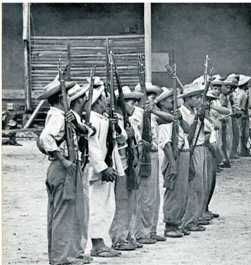
Mercenarios Yanquis en Nicaragua

el presidente títere Estrada Palma, quien solicita la intervención militar de EE.UU. Los norteamericanos desembarcan y designan como interventor a William Taft.