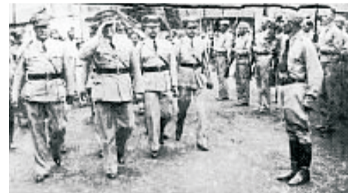
Anastasio Somoza García, el asesino de Sandino