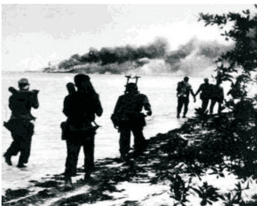
Marines yanquis en Playa Giron