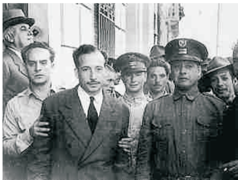
Derrocamiento de Jacobo Arbenz

célebre Escuela de las Américas, para la formación de los militares del hemisferio. Allí se formaron los principales protagonistas de las dictaduras militares en Brasil, Argentina, Uruguay, Chile, Centroamérica y en otros países.