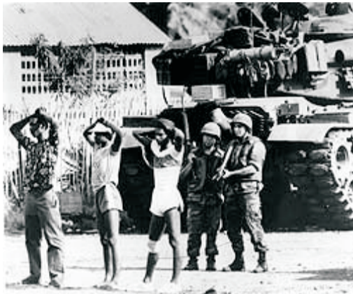
Marines en Granada

quien se había demostrado demasiado amistoso con Cuba.