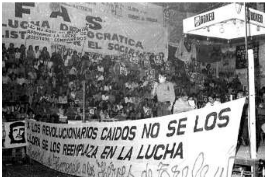
Acto homenaje a los compañeros a un año de la masacre

Así como hoy en día decimos que los asesinos de Maxi y Dario en Pte. Pueyrredón fueron el detonante de la caída de Duhalde, la masacre de Trelew fue el fin de la dictadura de la "Revolución Argentina" que pretendió encauzar el río de lava justiciera, río de lava socialista del volcán cubano, volcán de ejemplo, volcán de valor, volcán revolucionario que incendió a América latina durante 20 años (59-79), cuando ardió Nicaragua en