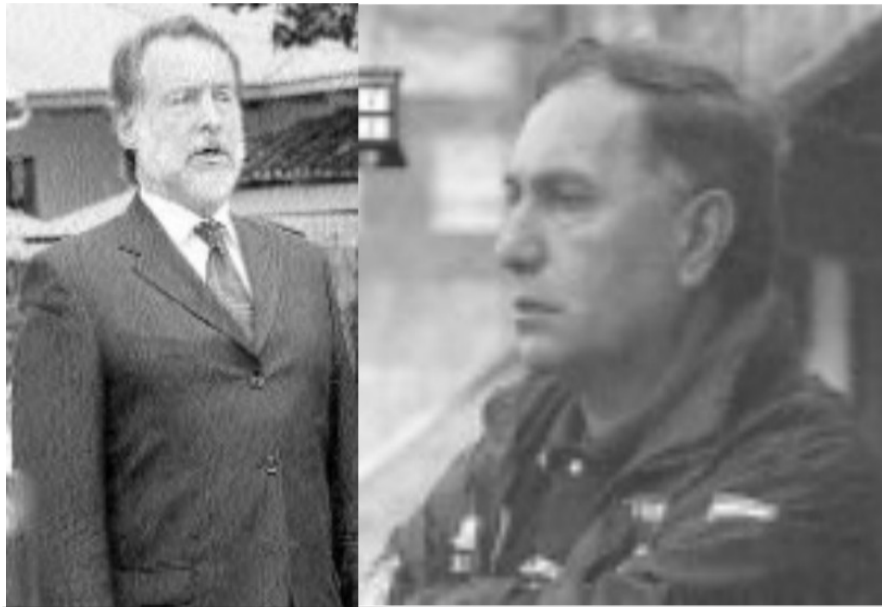
Bielsa, Admirador de Kairuz

Pero tanta teatralidad no alcanzó para disimular su pertenencia a una clase capaz de manipular los versos de Gonzáles Tuñón (se